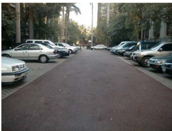
透水性瀝青混凝土