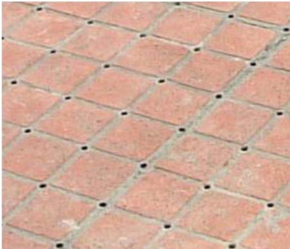
環保透水透氣混凝土鋪面